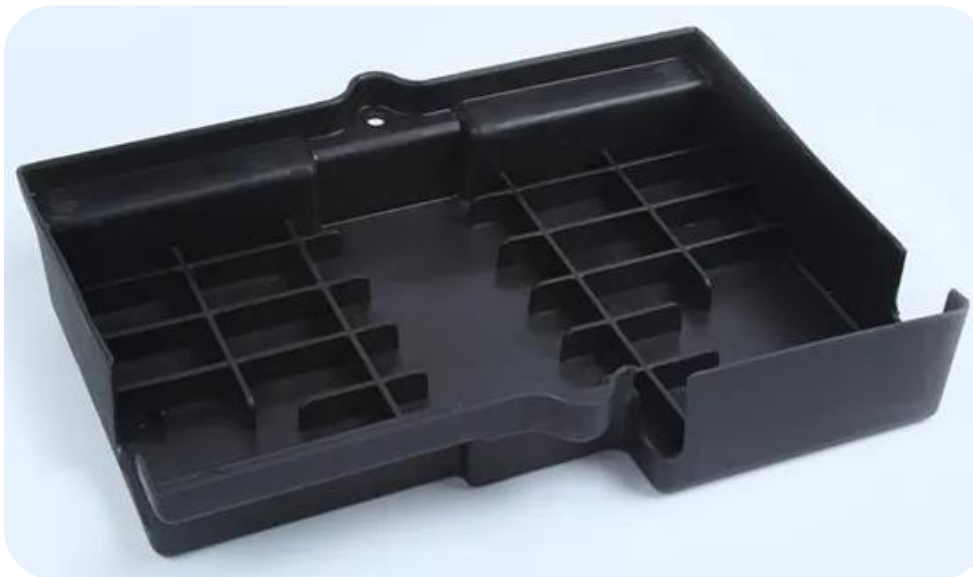
Корпус батареи из формованного материала SMC с высокой огнестойкостью

SMC-кожухи для стационарных накопителей Fluence, Tesla Megapack.