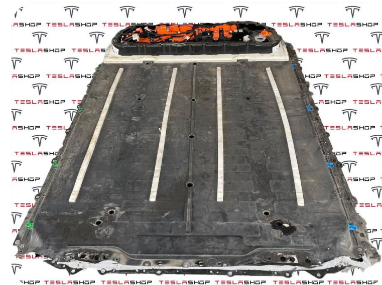
Корпус высоковольтной батареи из SMC материала для Tesla Model Y2021